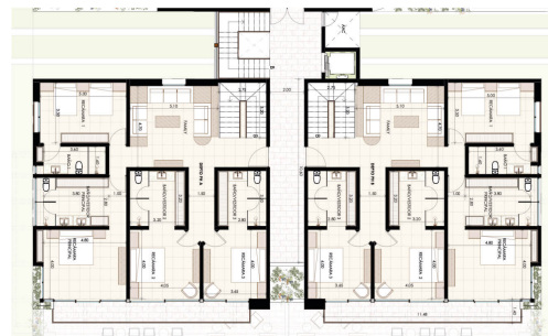
Plantas Penthouse | Planta alta

Sales and rentals +52 744 107 4026 +52 744 446 7080